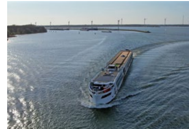
Die Excellence Crown auf Inspektionsfahrt in den Niederlanden am 31.03.25