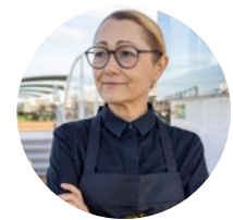
Starköchin Tanja Grandits ist Taufpatin der «Crown».